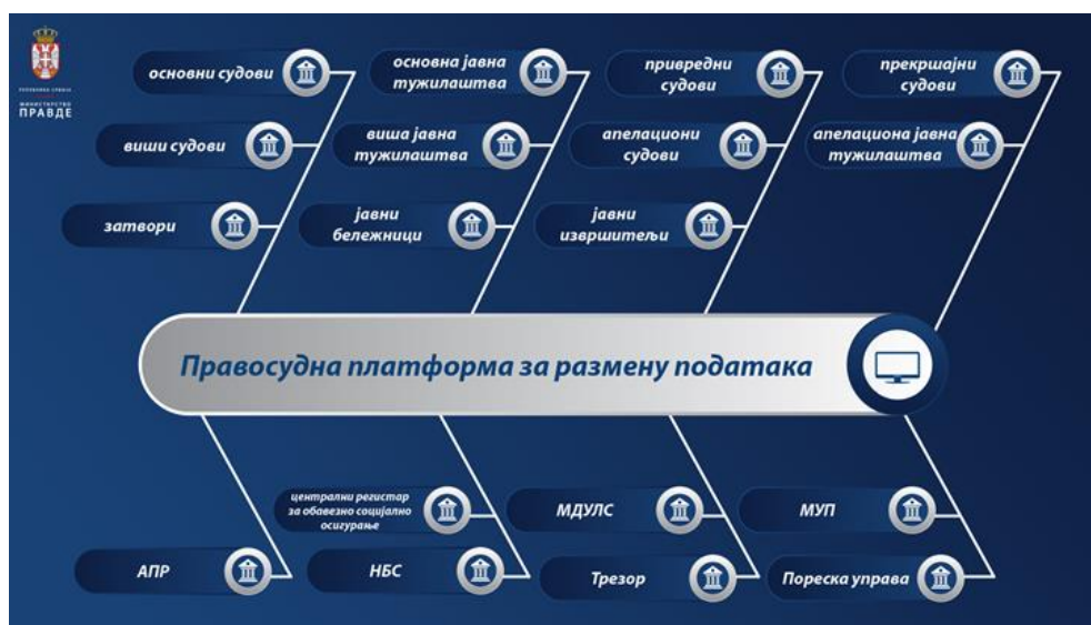
Слика 1. Скица система Enterprise Service Bus-a

Инфраструктурна платформа за интероперабилност представља систем који омогућава електронску размену података између различитих правосудних институција и државних органа ван система правосуђа. Правосудна платформа за размену података заснована је на Enterprise Service Bus који је вендорско решење компаније Мајкрософт ( Microsoft BizTalk Server ), док је Правосудни информациони систем портал за приступ корисника сету података за који су посебно овлашћени користећи наведени ЕСБ односно Правосудну платформу за размену података. (Слика 1.)